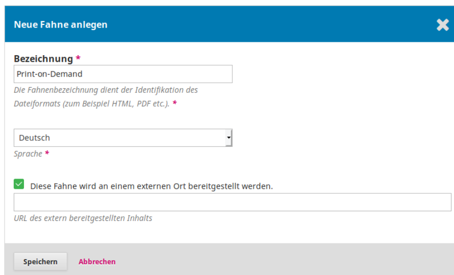
Abbildung 1 Dialog „Neue Fahne anlegen“

Achten Sie beim Export von Daten für die Übergabe an Drittanbieter darauf, welche Daten Sie gemäß der geltenden Datenschutzverordnung weitergeben dürfen.